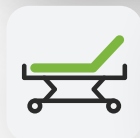
Rückenteil 0 – 70°

Das Pflegebett Ecofit S Low ist speziell für die häusliche Pflege entwickelt. Seine hohe Funktionalität und Langlebigkeit macht es zum idealen Produkt in diesem Bereich. Die besonders niedrige Einstiegshöhe erleichtert kleineren Personen den Einstieg oder dient der Sturzprophylaxe.