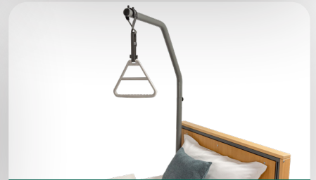
Aufrichter mit Triangel-Handgriff