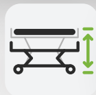
Höhe 270 – 695 mm