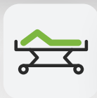
Fußteil 0 – 30°