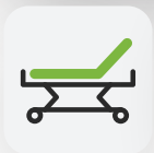
Rückenteil 0 – 70°

Das Pflegebett Ecofit S Comfort überzeugt durch zusätzliche Funktionalität: Der Matratzenausgleich und die Antitrendelenburglagerung erleichtern zusätzlich den Pflegealltag für Bewohner und Pfleger.