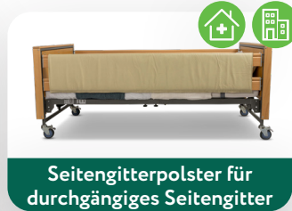
Seitengitterpolster für durchgängiges Seitengitter