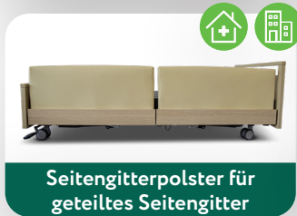
Seitengitterpolster für geteiltes Seitengitter