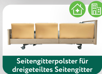
Seitengitterpolster für dreigeteiltes Seitengitter