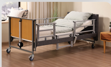
Stahl SG, 3- geteilt