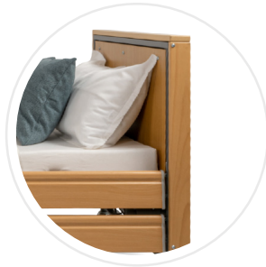
Ecofit S Plus