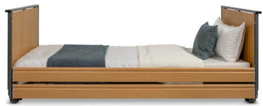
Ecofit S Low