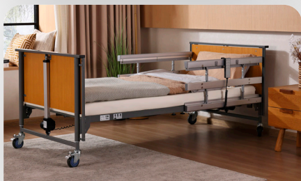
Aluminium SG, geteilt